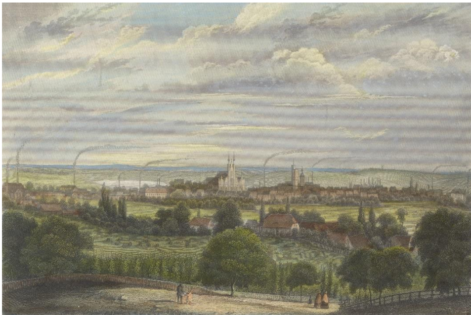
Widok Świebodzina z ok. poł. XIX wieku - wyd. B.S. Berendsohn (Hamburg 1860)